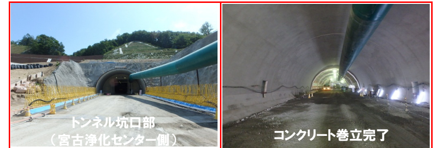
②施工：前田建設工業