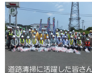
道路清掃に活躍した皆さん

約2時間の清掃活動で多くのゴミが回収され道路が綺麗になりました。特に多かったのは、飲料水のペットボトル、たばこの吸い殻でした。