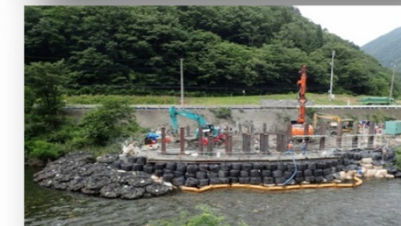
仮橋工事を対岸から望む