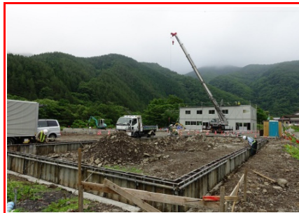
⑧施工：戸田・岩田地崎JV